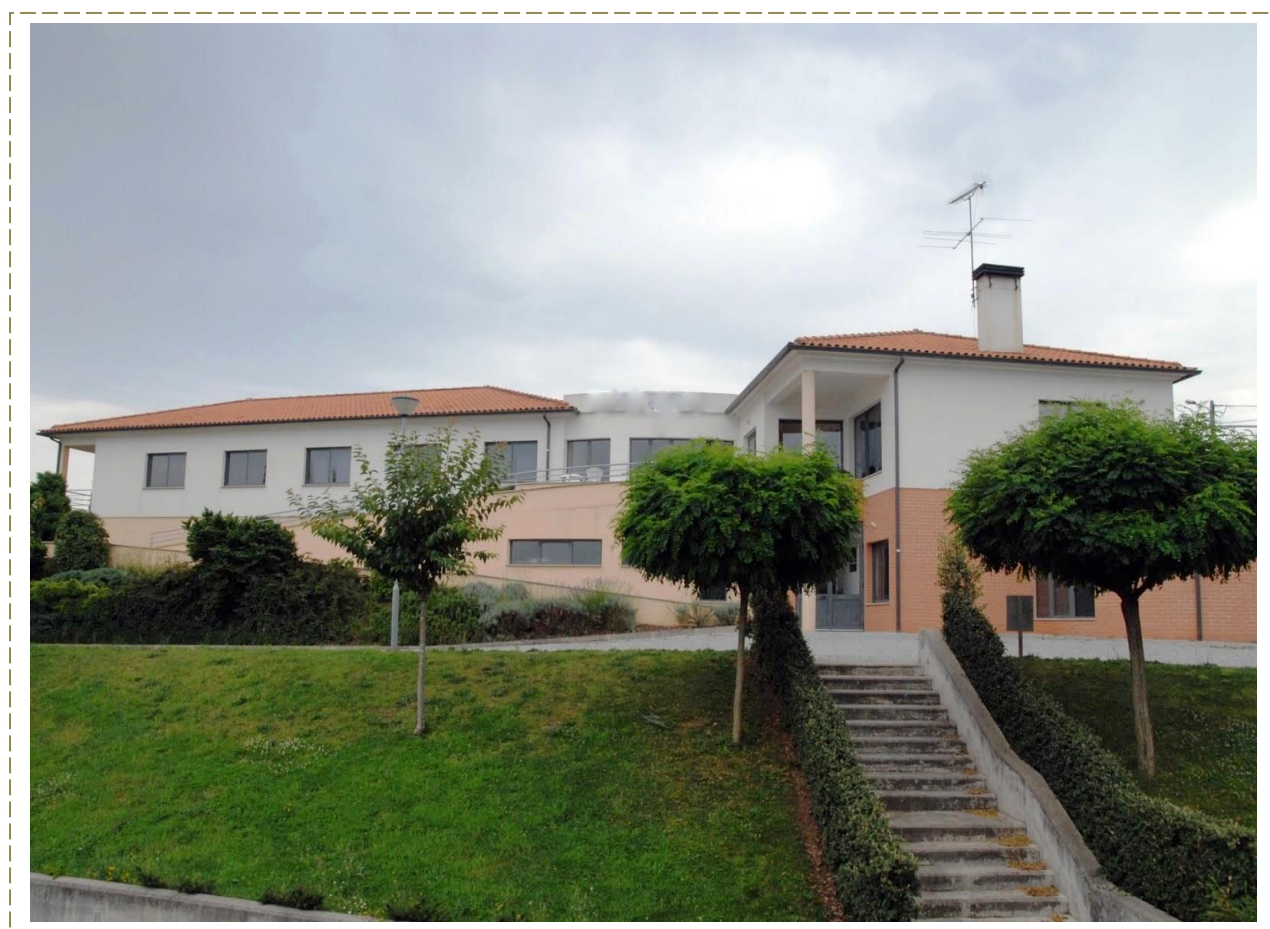
(Edifício Sede – Centro Social Tourigo – IPSS)

Designação: Centro Social do Tourigo - IPSS